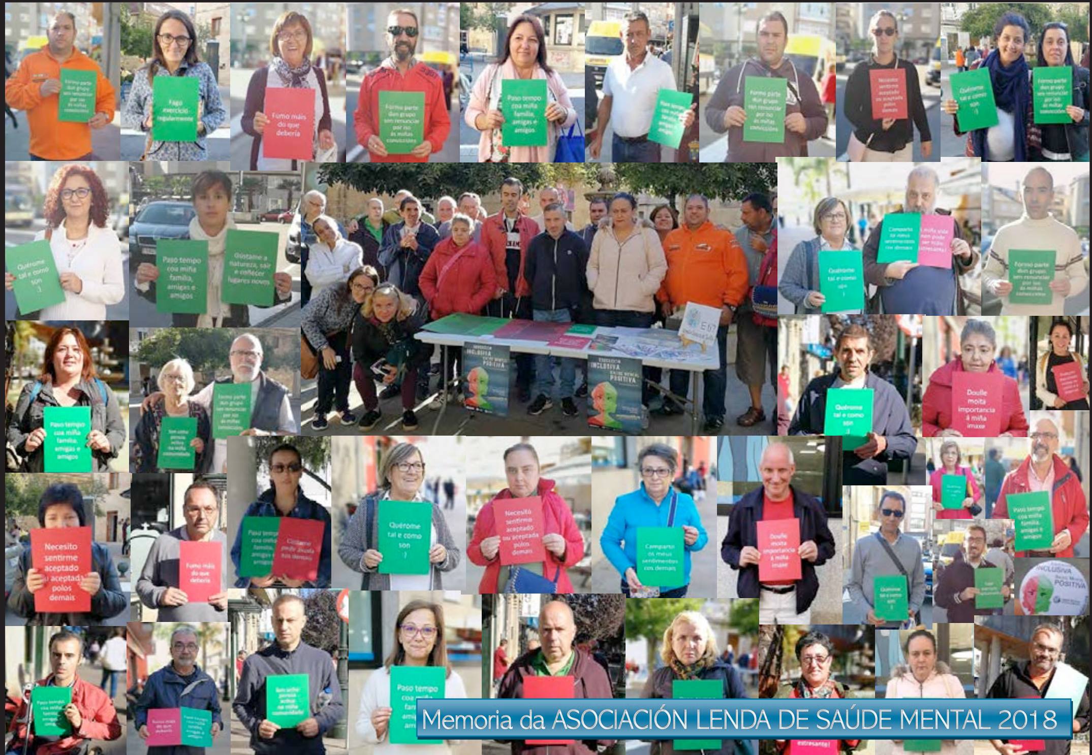
Memoria da ASOCIACIÓN LENDA DE SAÚDE MENTAL 2018